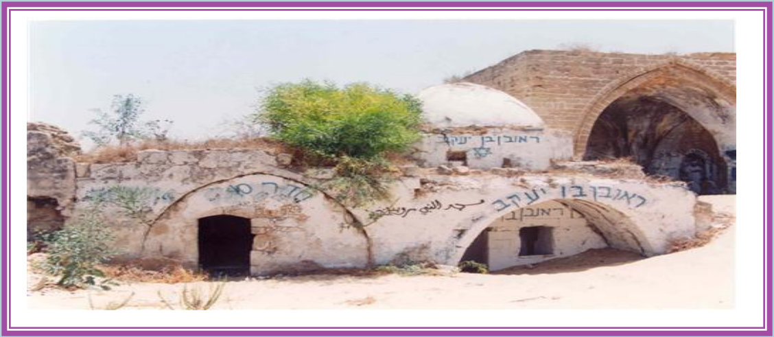
مسجد قرية بيت دجن قضاء يافا