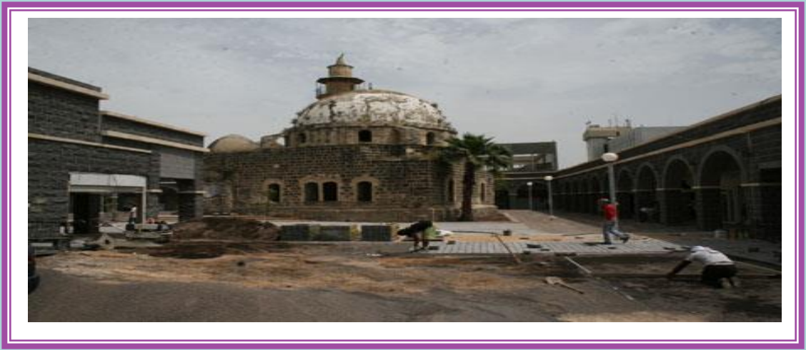
مسجد السوق الزيداني - مدينة طبرية