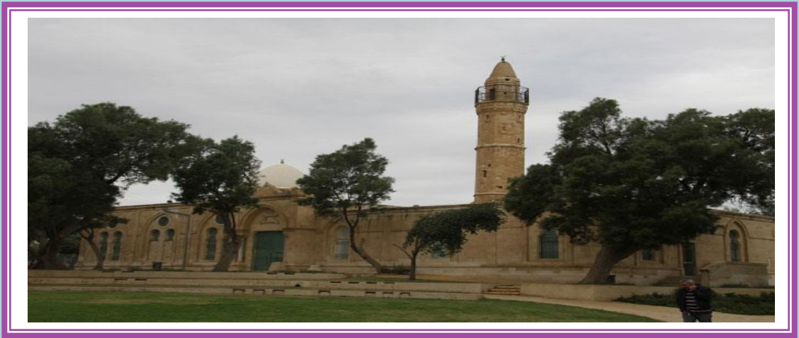
المسجد الكبير في مدينة بئر السبع