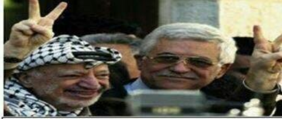
حركة التحرير الوطني الفلسطيني - فتح إقليم استراليا