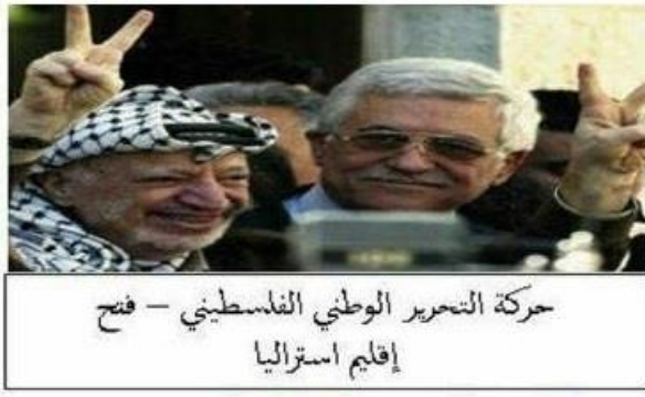
حركة التحرير الوطني الفلسطيني - فتح إقليم استراليا