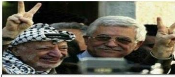
حركة التحرير الوطني الفلسطيني - فتح إقليم استراليا