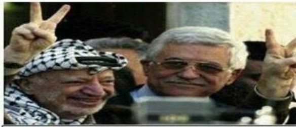
حركة التحرير الوطني الفلسطيني - فتح إقليم استراليا